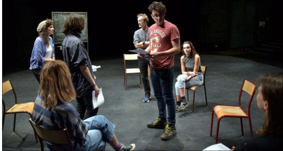
La pièce Le Promontoire imaginée par Cécile Arthus et Fabien Joubert est en pleine création au Nest de Thionville.

« On aurait dû présenter lors de la Semaine extra, en avril, Eldorado dancing . Ça n'a pas pu se faire. Mais on repart de plus belle avec une pièce immersive intitulée Le Promontoire . » À l'origine du projet ? Le service public de lecture. « Fabien Joubert, de la compagnie O'Brother de Reims, a lancé une action dans les lycées. Fabien, que j'ai rencontré à Mulhouse, est animé depuis longtemps par cette envie de