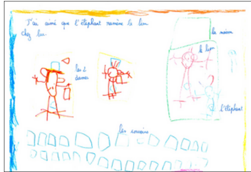
Dessins d'enfants de l'école maternelle de Cosmes, « Festival Les Embuscades » Cossé le Vivien.