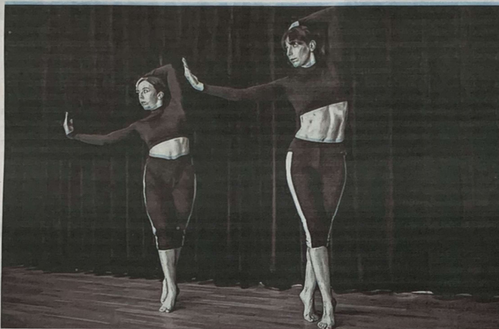
La compagnie Oups : deux danseuses originales qui détournent les codes de la danse.