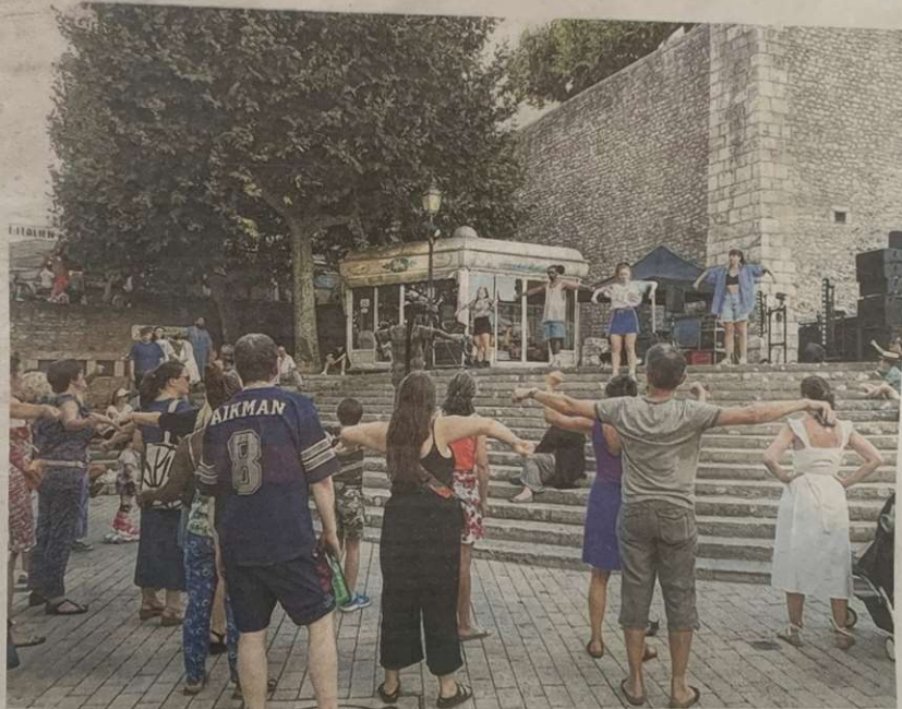
Le public a pu s'initier aux mouvements de base de l'electro dance.