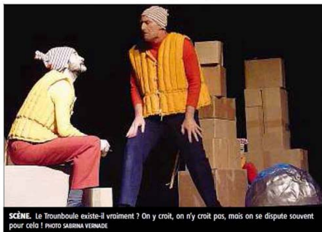
SCÈNE. Le Trounbole existe-il vraiment ? On y croit, on n'y croit pas, mais on se dispute souvent pour cela !