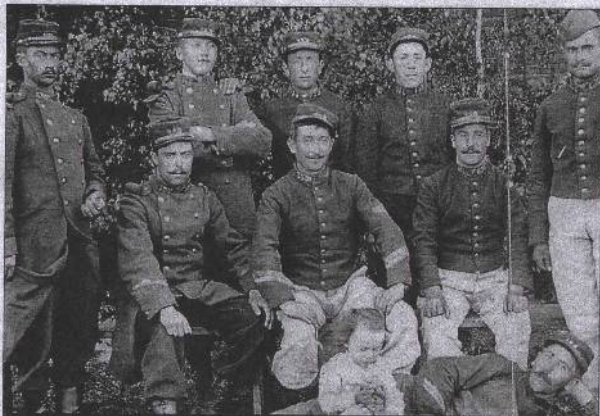
PREMIÈRE GUERRE MONDIALE. Résistance 1, demain, à la salle des fêtes de Gentioux, choisit de raconter le destin de Marc, jeune Poilu de la Guerre de 1917.

Aux quatre premiers épisodes, qui peuvent être vus indépendamment, viendront bientôt s'ajouter trois nouveaux portraits pour une création qui s'étale sur sept ans, de 2006 à 2012 (voir par ailleurs).