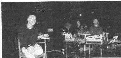
Les trois artistes après la présentation d'une première ébauche de leur spectacle.

Prochaine « échographie » en janvier prochain, lors du retour en résidence à Clvray. Le spectacle sera joué à la salle de La Margelle le 20 mars 2013.