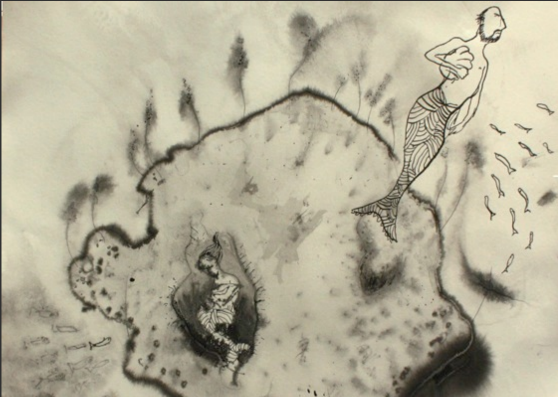
Illustration Antoine Blanquart