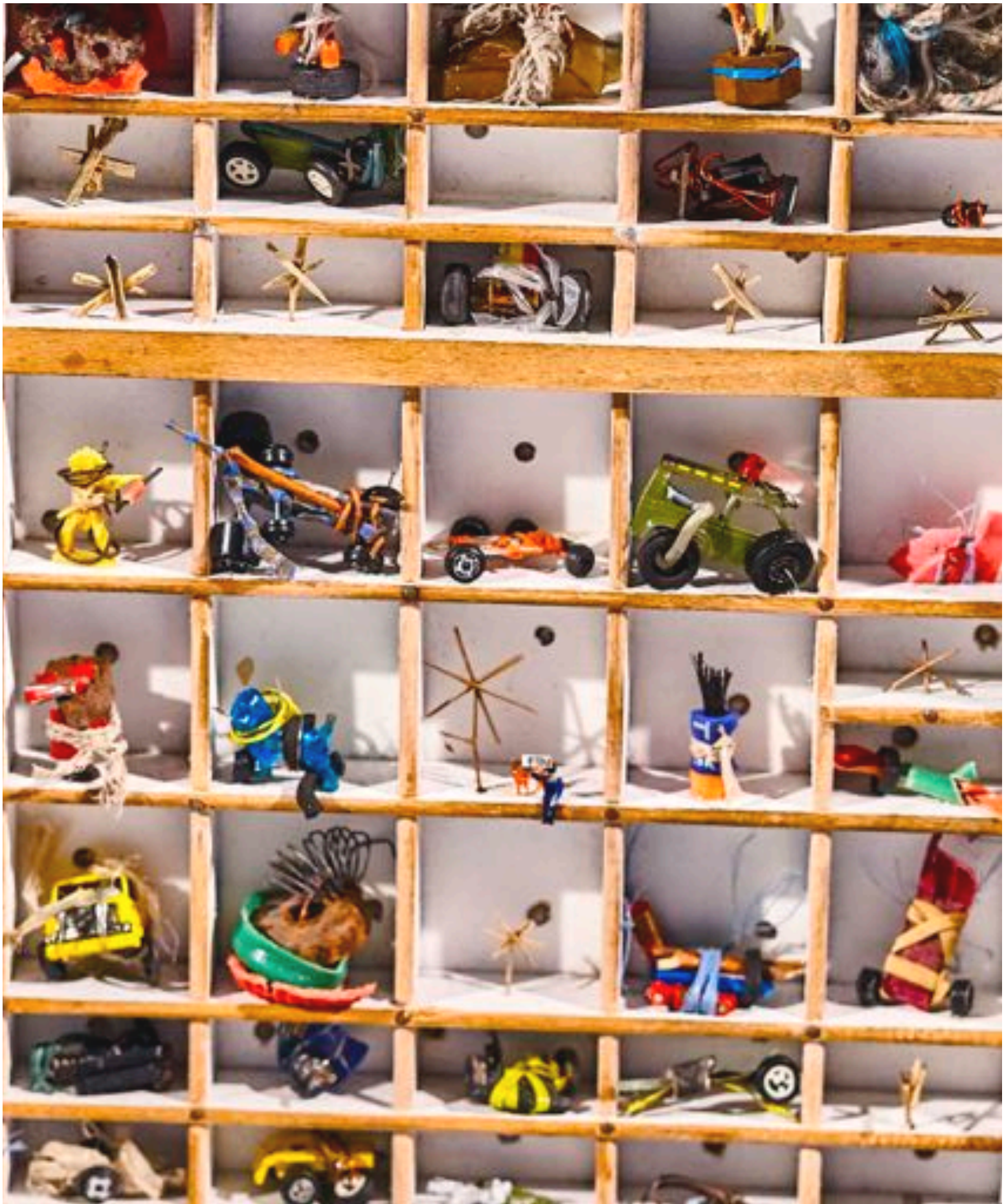
Détail d'un théâtre miniature