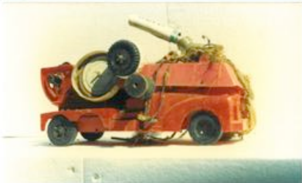
Les créations/jouets de Jean Bordes.