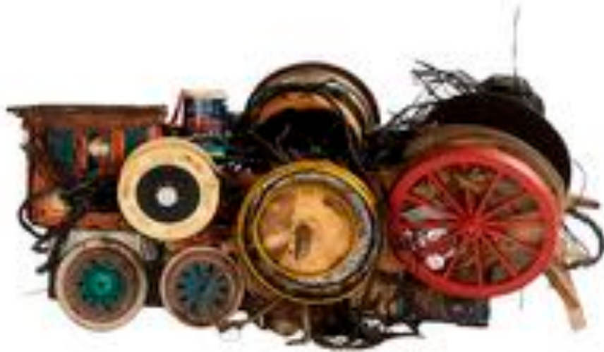
ENGIN Matériaux de récupérations. 19x40 cm