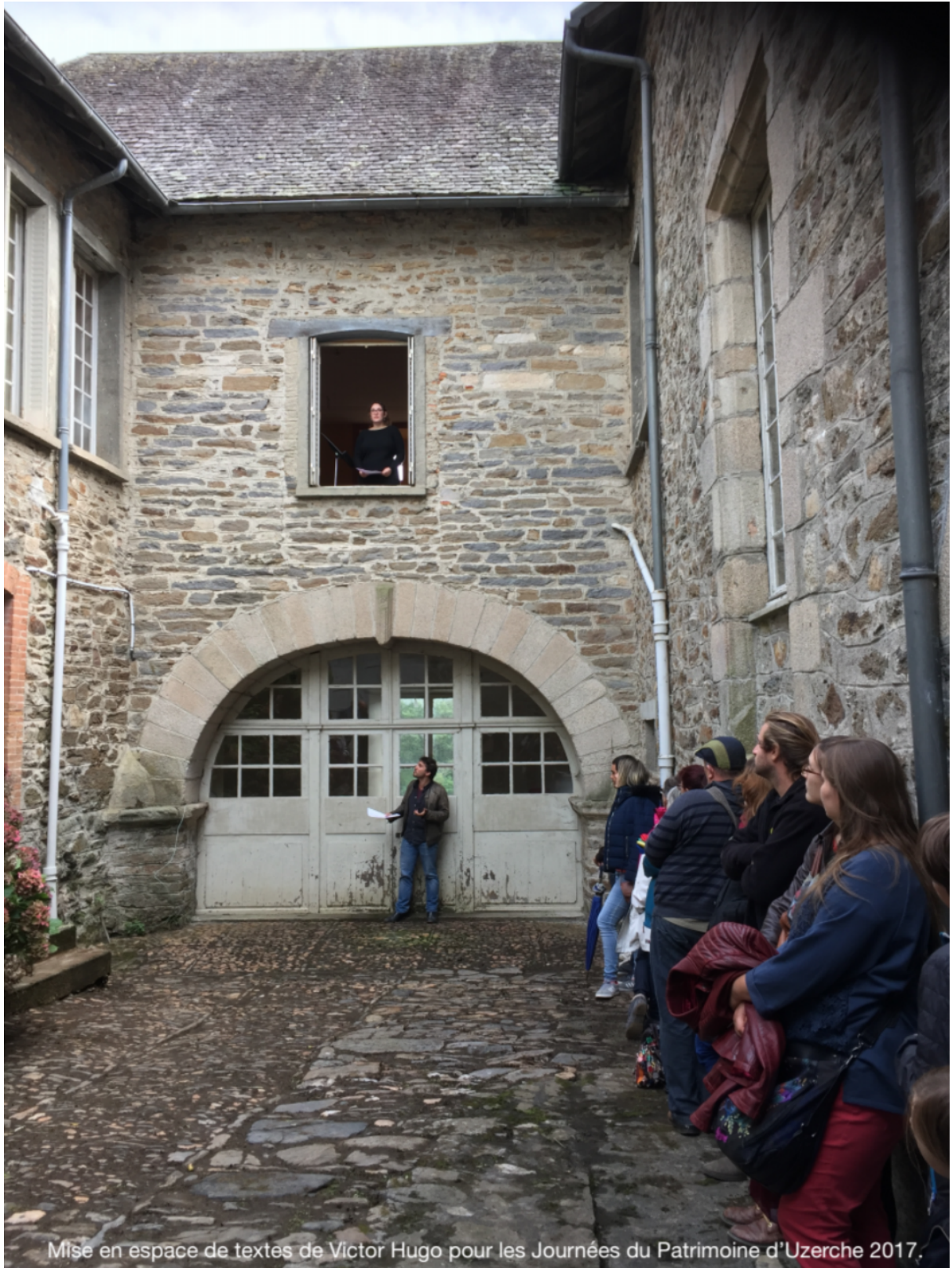
Mise en espace de textes de Victor Hugo pour les Journées du Patrimoine d'Uzerche 2017.